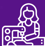
Samostalni modni dizajner

Student koji diplomira na studijskom programu Modni dizajn osposobljen je da samostalno ili kao deo tima, bude na radnom mestu: