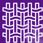
Dizajner unikatnog tekstila