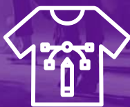
Dizajner grafičkih rešenja u okviru mode